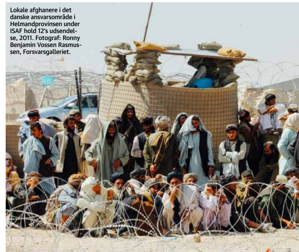
Lokale afghanere i det danske ansvarsområde i Helmandprovinsen under ISAF hold 12's udsendelse, 2011.

DIIS-forskeren kalder tolkene ”en overset faggruppe” og så gerne, at man lavede nye regler på området. Alt forskning viser nemlig, at de er nogle af de mest