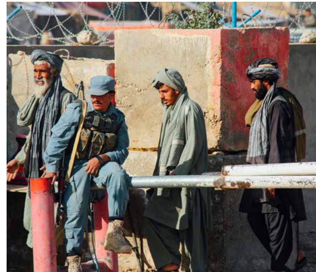
Billeder af lokale afghanere. Taget af Kim Vibe Michelsen i forbindelse med International Security Assistance Force (ISAF), 2012. Udlånt af Forsvarsgalleriet.

”Så tolkene gik ind og forklarede situationen, sørgede for, at vi sendte mad og vand over til dem, og fik gemytterne til at falde til ro. Det var en situation, som kunne være endt farligt på grund af frustrationer og