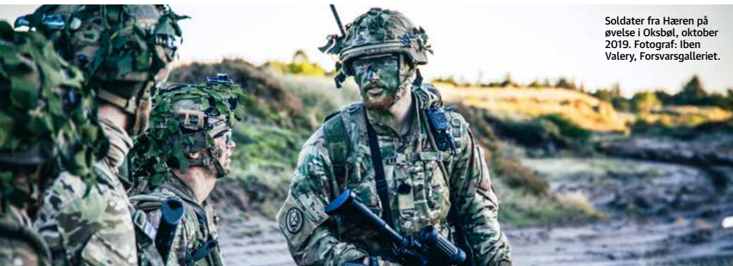
Soldater fra Hæren på øvelse i Oksbøl, oktober 2019.