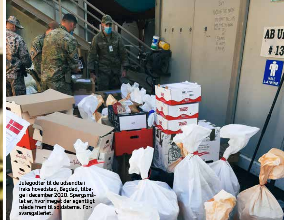
Julegodter til de udsendte i Iraks hovedstad, Bagdad, tilbage i december 2020. Spørgsmålet er, hvor meget der egentligt nåede frem til soldaterne. Forsvarsgalleriet.